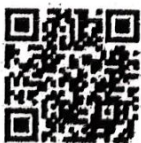
การใช้งานและการบำรุงรักษา

มูลนิธิอาสาเพื่อนพึ่ง (ภาฯ) ยามยาก สภากาชาดไทย